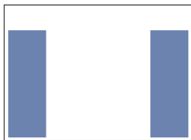
skyscraper : 2 X 150 X 750 pixels