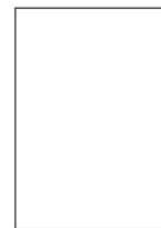
carré 300 X 250 pixels